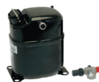
CAJ/R - TAJ/R