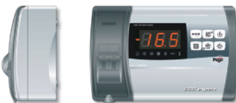
ECP 202 EXPERTS