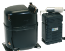
CAJ/S - TAJ/S